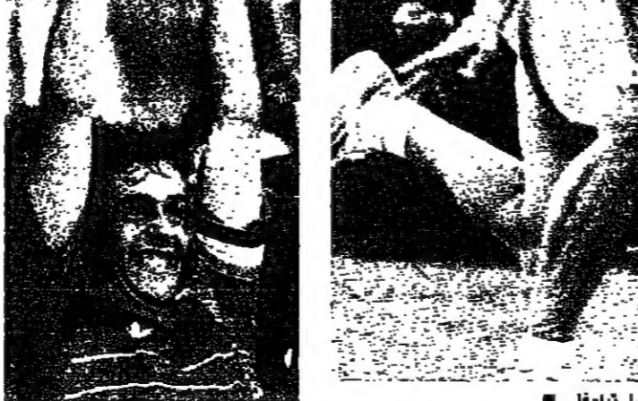
مارتينا نغرا لياوفا